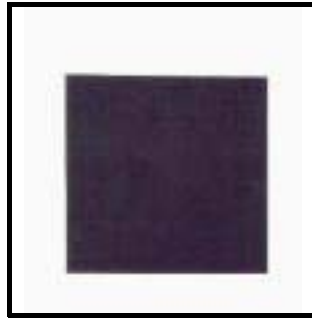
Malewitsch: Das Schwarze Quadrat