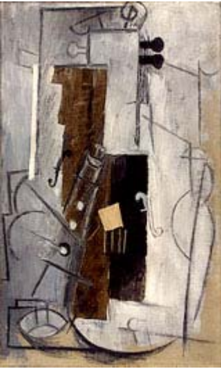
Picasso: Klarinette und Violine , 1913

Die unfassbare, tanzendierende Kraft der Farben zu lenken, war hingegen das Bestreben von Piet Mondrian. Ausgehend von dem ebenfalls der Musik entlehnten Prinzip der Harmonie, schuf er von 1910 an seine ersten Farbkombinationen. Diese zunächst beinahe farblosen Rasterbilder gewinnen im Verlauf der Jahre immer klarere, leuchtendere Farbtöne hinzu; 14 bis in den Jahren 1930-33 viele seiner Bilder wiederum gänzlich ihre Farbigkeit verlieren.