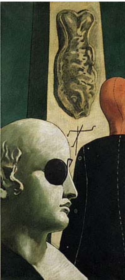
G. Chirico: La nostalgie...

Dieses Anliegen lässt sich in gleicher Weise für die schwarzen Umrahmungen der Figuren Fernand Légers vermuten. Den bedrohlich dynamischen Charakter des bunten Lebens neutralisiert er zudem durch die maschinenhafte Darstellungsweise seiner Menschen. So wird der Mensch bei ihm, wie bei den 'Stijl-listen' die Farben, zum funktionellen Element einer umfassenden Konstruktion reduziert.