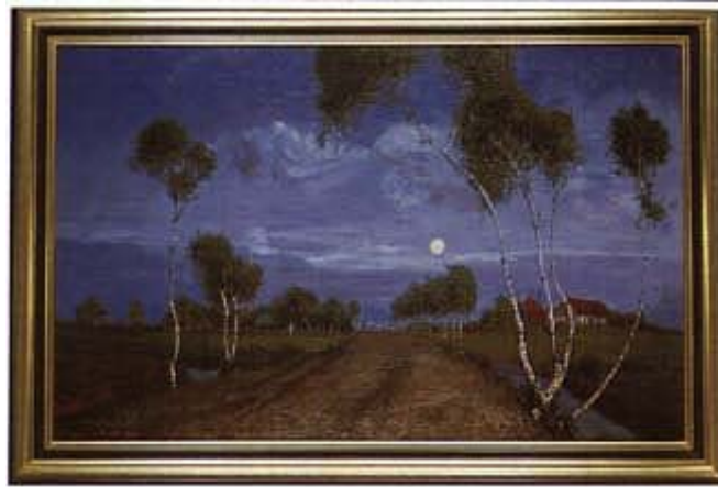
F. Overbeck: Mondaufgang

Dies führt uns zu der letzten Station der knappen geschichtlichen Retrospektive, zu den Worpsweder Malern am Übergang vom 19. ins 20. Jahrhundert. Denn von ihnen wird ebenfalls berichtet, sie seien immer wieder des Nachts in die verlassenenen Moorlandschaften hinausgegangen, um dort im Mondlicht ihre dunkelbrauntonigen Bilder zu schaffen. Wie es in den Gedichten R. M. Rilkes, der lange Jahre in dieser Künstlerkolonie lebte, zum Ausdruck kommt, war ihnen die Nacht ein Zeichen der Gottesferne; darüber hinaus jedoch Ausdruck von Tiefe und Stille. Ihr Zeitgenosse Vincent van Gogh beschreibt, anders gewendet, den gleichen symbolischen Zusammenhang gegenüber seinem Bruder so: 'Ach, die Leute, die hier nicht an die Sonne glauben, sind fast gottlos.' 7 Mit seiner Prophezeiung hingegen, 'dass der Maler der Zukunft farbiger ist, als es ihn je gab' 8 , sollte er nicht Recht behalten.