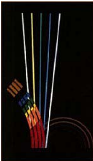
F. Picabia: La Musique...

Ein weiteres Element, ebenfalls eng mit der schwarzen Farbe verknüpft, hat der Dadaismus in weitem Umfang in die Malerei eingeführt: die Schriftzeichen. Durch die Bilder von Georges Braque schon im Kubismus als Gestaltungsmittel angedeutet, wird es im Dadaismus gleichwertig neben traditionellere Symbole gestellt. Sie sind der abstrakte graphische Ausdruck des Gedankens. An der Schrift wird die Idee des Künstlers, die dem Kunstwerk voranging, ablesbar. Auch dies ist somit letztlich eine Relativierung der reinen Abstraktion. Die Pop-Art hat diese Kombination über den Umweg der Verarbeitung von Comicmotiven wieder aufgegriffen. Hier wie auch im Dadaismus wird mittels der Schrift der ironische Abstand zum oftmals allzu farben-frohen Bildinhalt geschaffen.