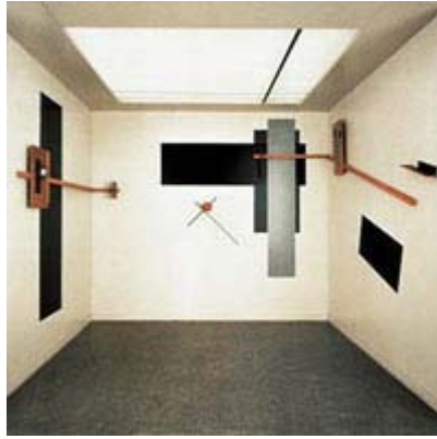
El Lissitzky: Der Raum Proun

In einer weitergehenden Konsequenz wird auf diesem Wege die Ebene des Bildes verlassen. Schon im Jahr 1923 schafft El Lissitzky seinen weißen mit vorwiegend schwarzen Elementen gestalteten Raum 'Proun'. Ein Konzept das besonders im Dadaismus zahlreiche Ausgestaltungen erfuhr, deren bekannteste wohl der 'Merz-Bau' von Kurt Schwitters wurde. Über das Bauhaus gewann die Idee vom Gesamtkunstwerk Einfluss in der Architektur und im Design: Schwarz und Weiß wurden auf diesem Wege zum Zeichen des Fortschrittes. 11