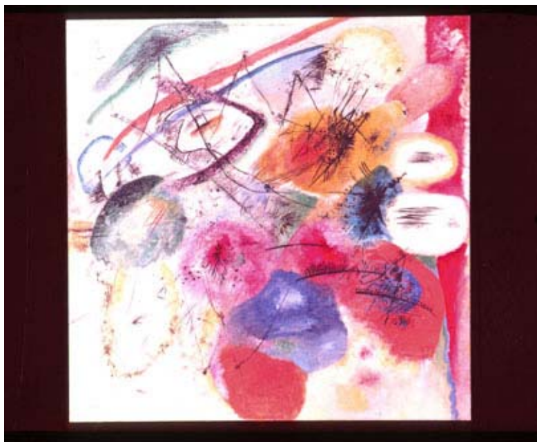
Kandinsky: Schwarze Linien, 1913

©Thomas Schukai, Postfach 610352, 22423 Hamburg E-Mail: post@thschukai.de